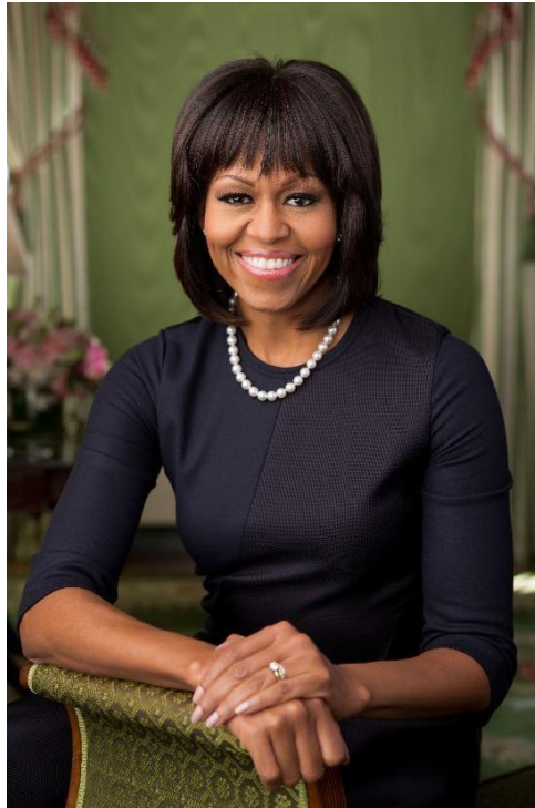
https://farm9.staticflickr.com/8532/8491445521_3fd1722dd7_o.jpg