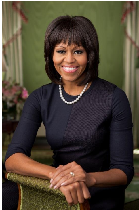
https://farm9.staticflickr.com/8532/8491445521_3fd1722dd7_o.jpg